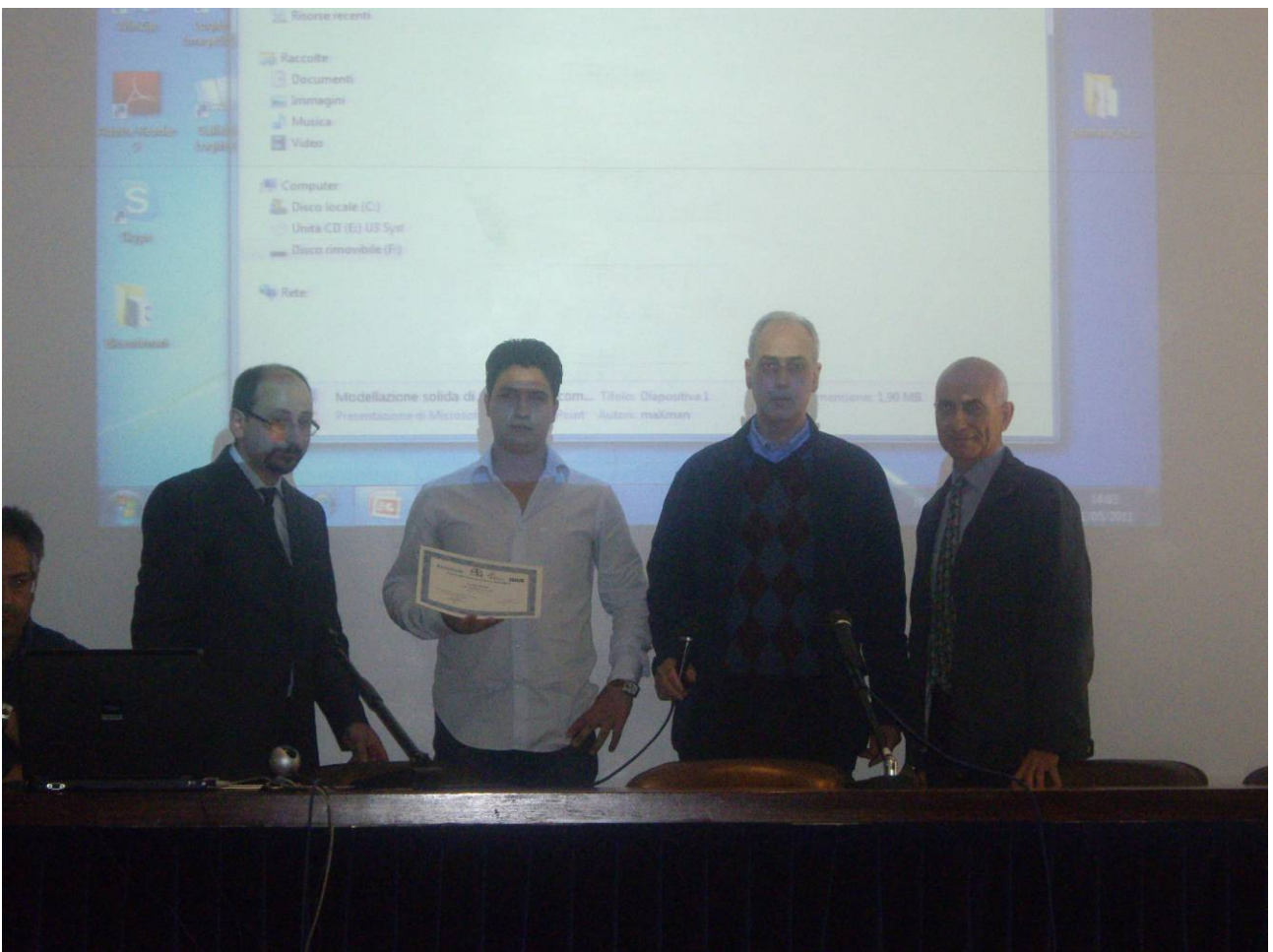
Premiazione dell'ITIS E. Majorana di Cassino (FR)