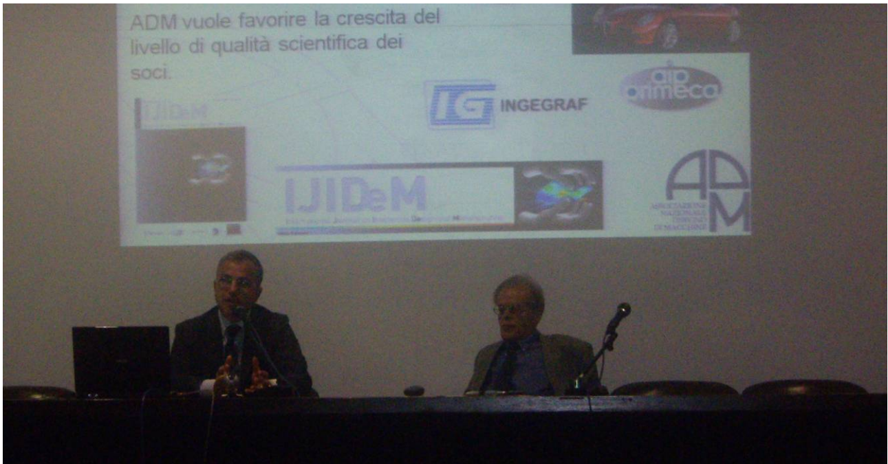
Presentazione dell'Associazione Nazionale Disegno di Macchine