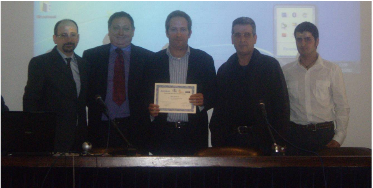
Premiazione dell'ITIS R. Elia di Castellammare di Stabia (NA)