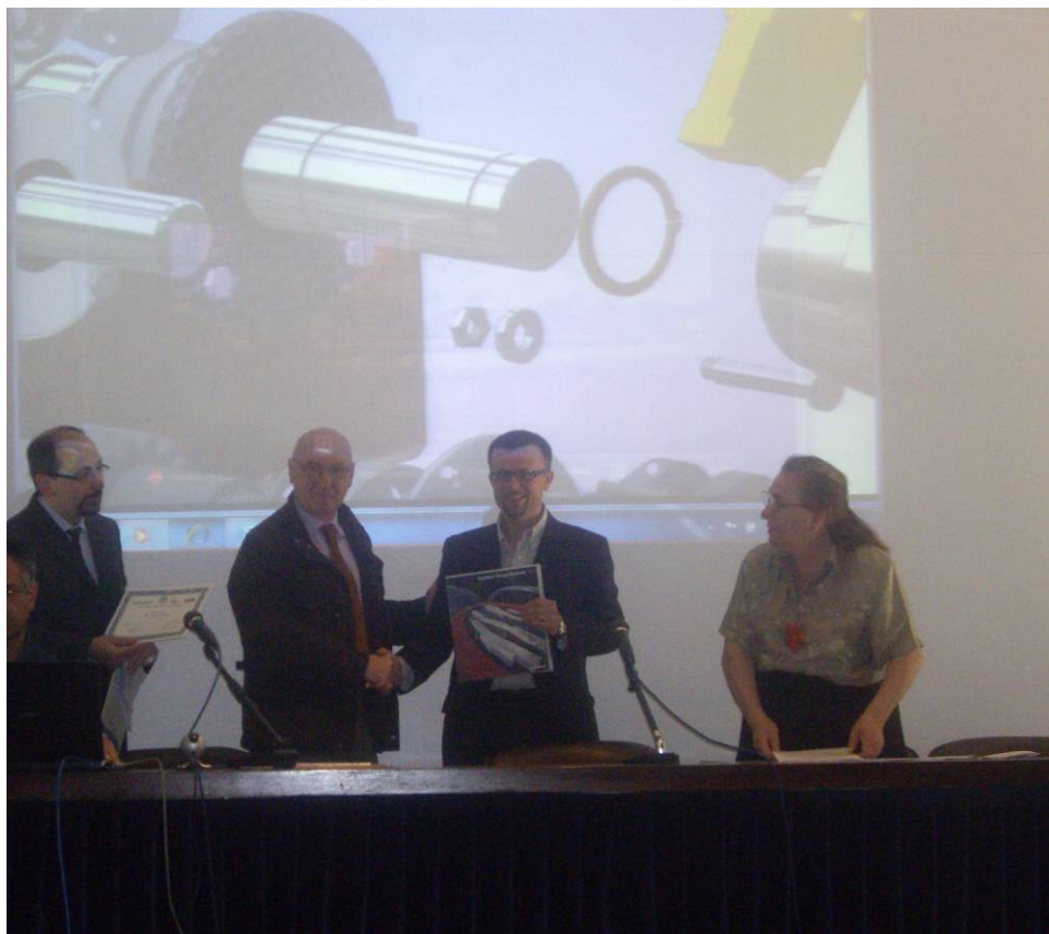
Premiazione dell'ITIS Paleocapa di Bergamo da parte di ADM, dell'Autodesk e di AICA