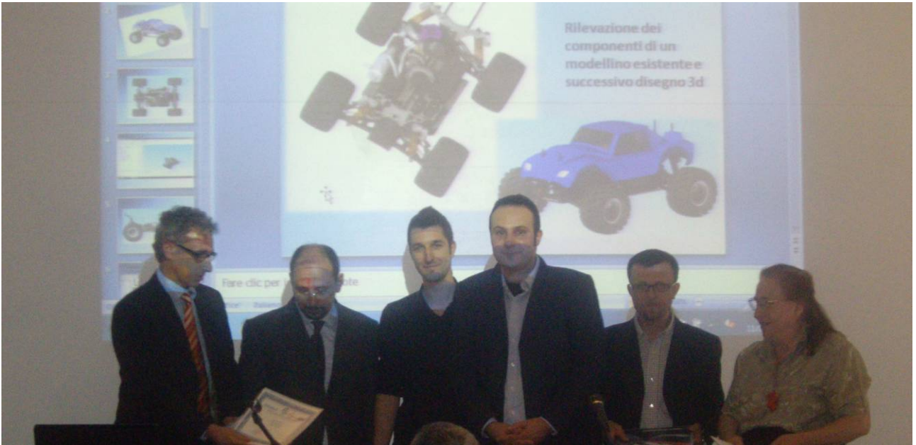
Premiazione dell'ITIS Aldini di Bologna