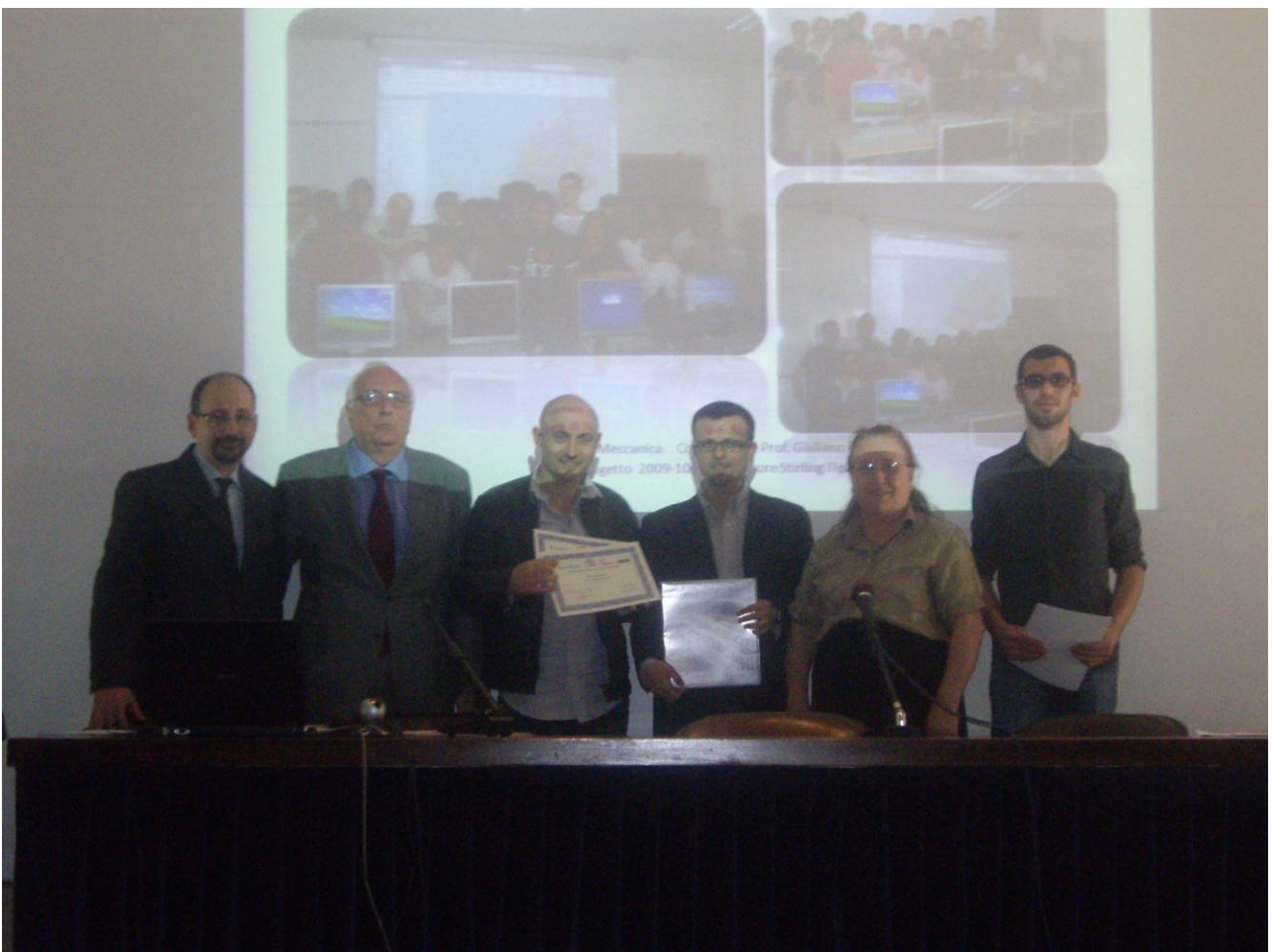
Premiazione dell'ITIS Marconi di Jesi (AN)