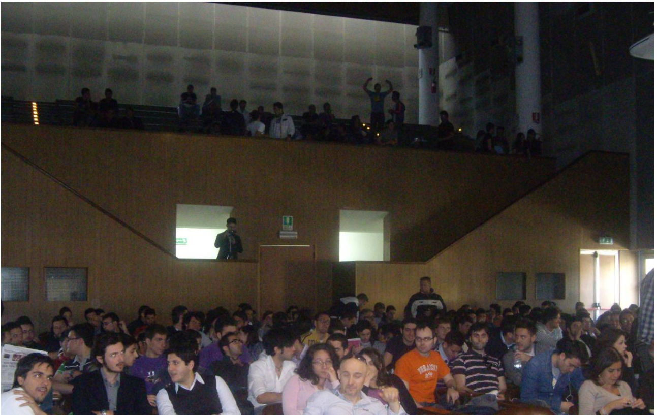
Sede della GN ADM 2011: Aula Magna "Leopoldo Massimilla" Facoltà di Ingegneria - Università degli Studi di Napoli Federico II